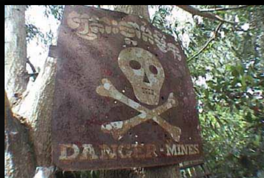
siam Heap - Camboja

De volta à África, numa parceria com a United Nations Volunteers – Botswana, UNV