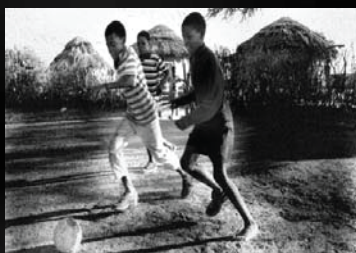
Futebol - Africa central