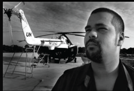
Becora - Timor-Leste

Em 2006 trabalhando para o ACNUR – agência da ONU para os refugiados fica responsável pela cobertura televisiva da visita do alto comissário das Nações Unidas para refugiados – Antonio Guterres.