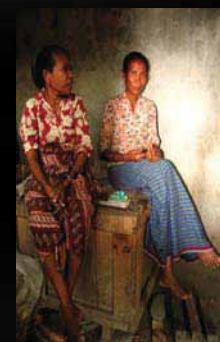
Colheita - Indonesia