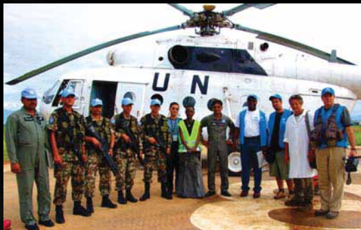
Missão de Paz de Burundi