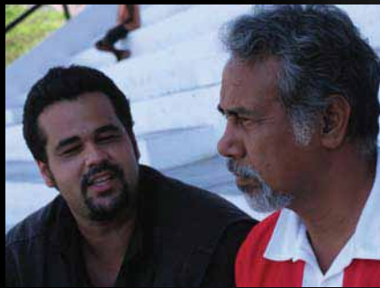
Presidente Xanana Gusmão

Ainda em 2005 viajou para o sudeste asiático a serviço do Ministério das Relações Exteriores – Agência Brasileira de Cooperação ABC e apoio da UNOTIL – Missão de paz da ONU no Timor para produzir uma série fotográfica e uma série de filmes documentários sobre a cooperação brasileira no Timor-Leste